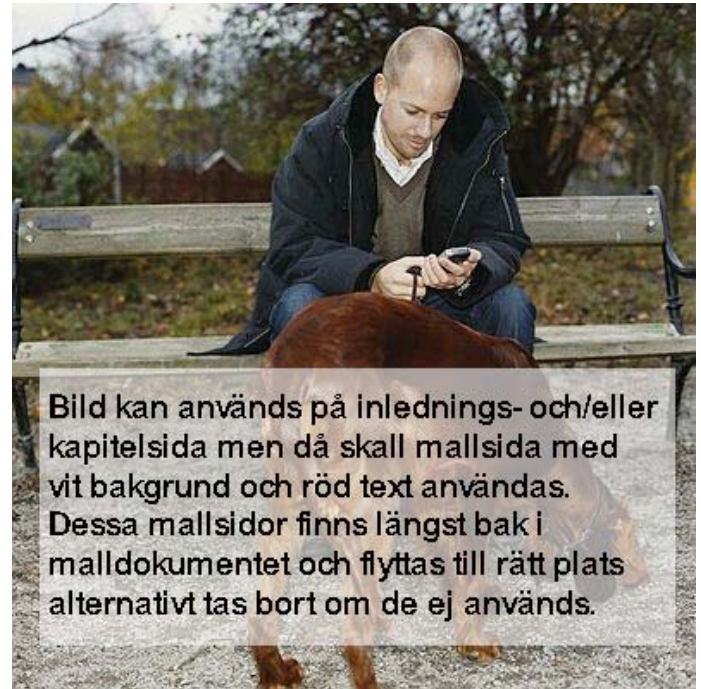
Bild kan används på inlednings- och/eller kapitelsida men då skall mallside med vit bakgrund och röd text användas. Dessa mallsidor finns längst bak i malldokumentet och flyttas till rätt plats alternativt tas bort om de ej används.