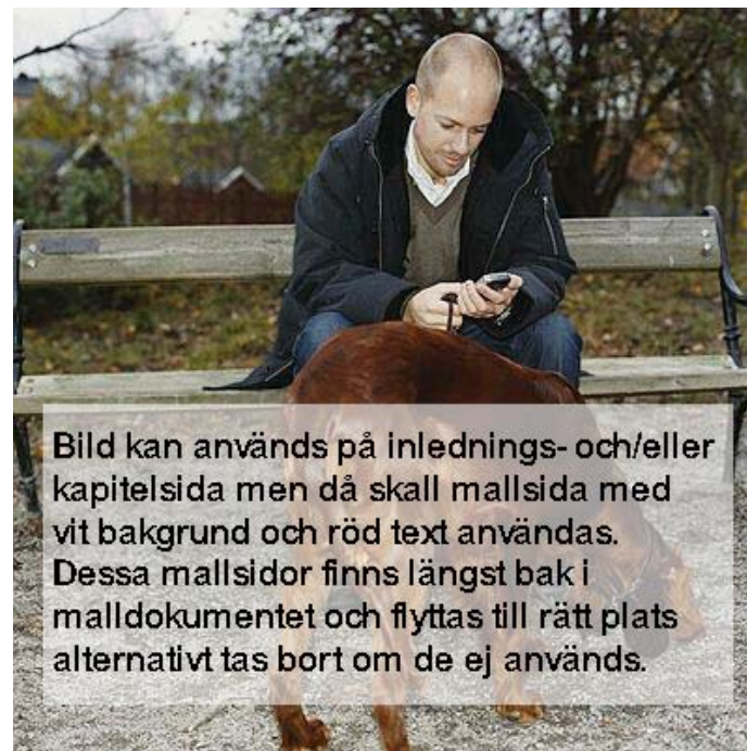
Bild kan används på inlednings- och/eller kapitelsida men då skall mallside med vit bakgrund och röd text användas. Dessa mallsidor finns längst bak i malldokumentet och flyttas till rätt plats alternativt tas bort om de ej används.